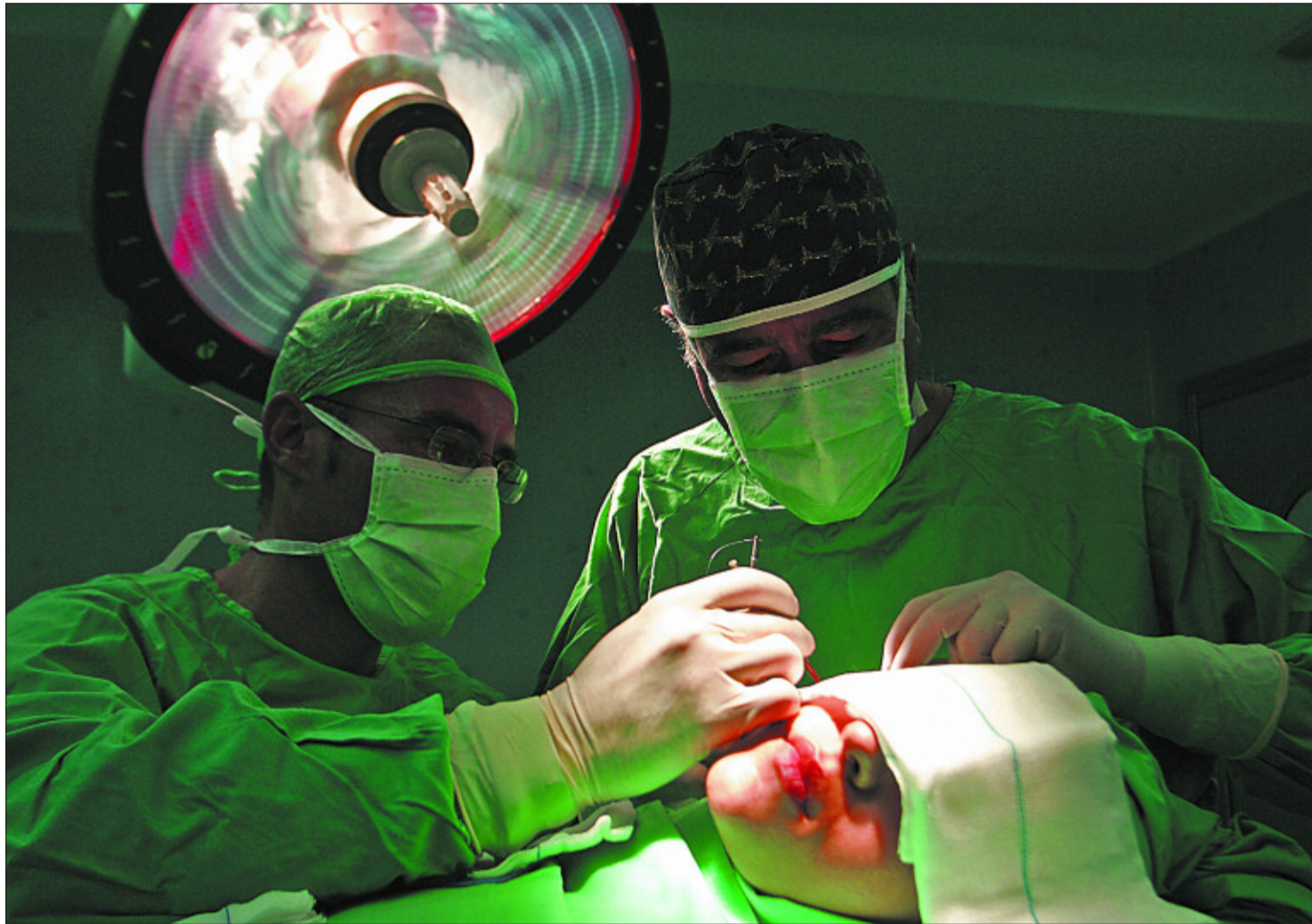
Dos cirujanos estéticos intervienen a una mujer en la cara.

Ellas prefieren una liposucción o un aumento de mamas. Ellos, que empiezan a despegar con fuerza y representan ya casi el 20% de la demanda, se inclinan por retocar las orejas o la nariz, pero también empiezan a pedir el retoque de bolsas y ojeras en la cara, o la liposucción de abdomen. El famoso lifting o estiramiento de las arrugas ha retrasado la cita con el bisturí hasta los 40-50 años, debido a la aparición de una amplia oferta en cirugía no invasiva, como los láseres de última generación, los rellenos y el famoso Bótox. Pero, de una forma u otra, el negocio está servido: un sector que nació con ansias de reparación de defectos congéni-