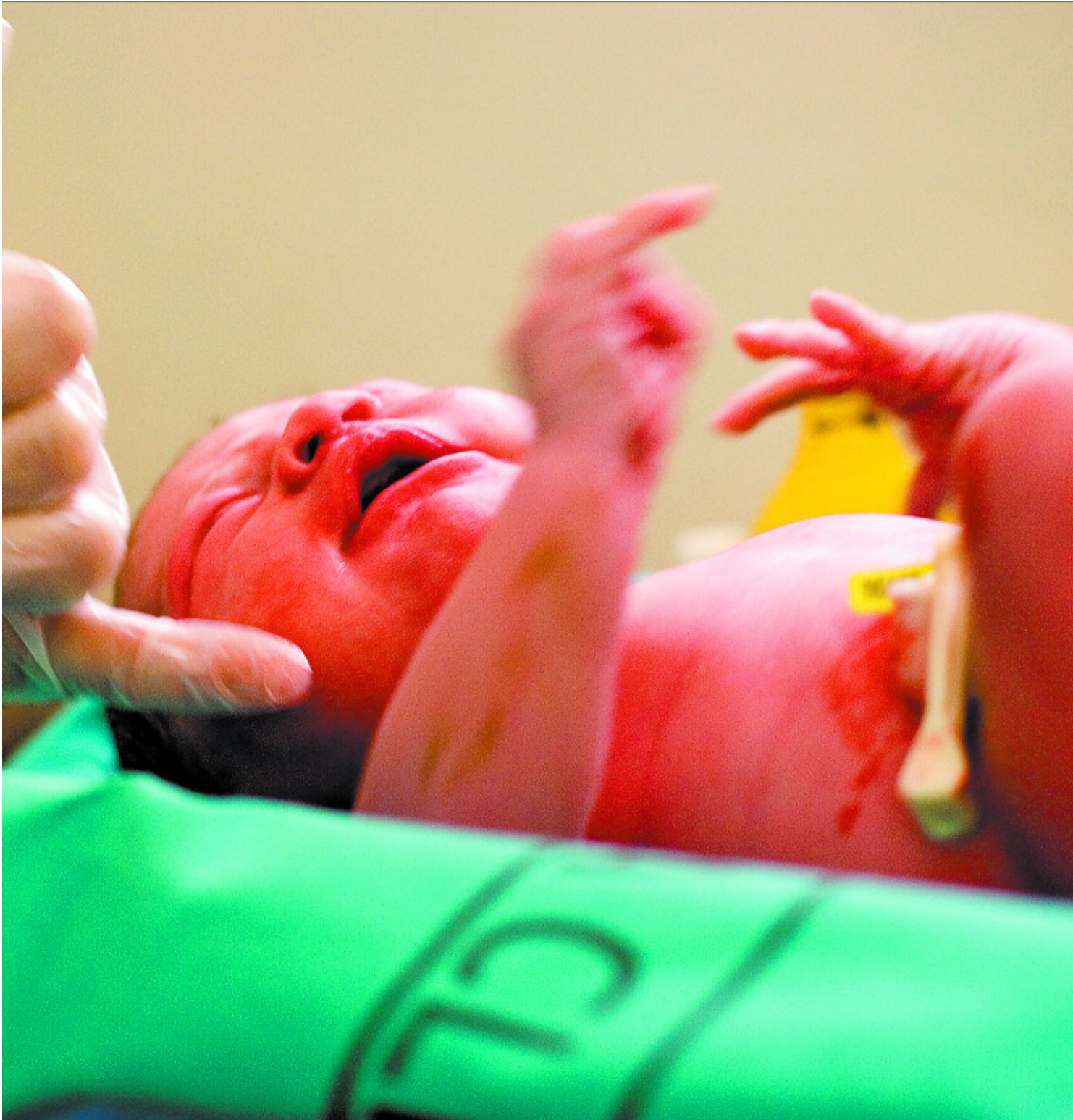
Un recién nacido mediante parto natural en la Maternidad del Hospital Clínico de Barcelona.

asistir cinco partos de forma paralela. Pero, a pesar de estas limitaciones, llevan años trabajando para respetar los deseos de las mujeres en el momento de parir y para conseguir que tengan un parto lo más normal posible. Los resultados, de nuevo, les avalan: en menos de 10 años, el porcentaje de episiotomías disminuyó más del 45% (del 99%, en 1998 al 42%, en 2006). “Cuando llegaron los protocolos de la Generalitat de Cataluña para favore-